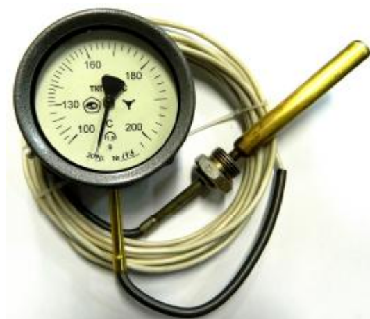
Общий вид термометров манометрических конденсационных показывающих ТКП-60С, ТКП-100С