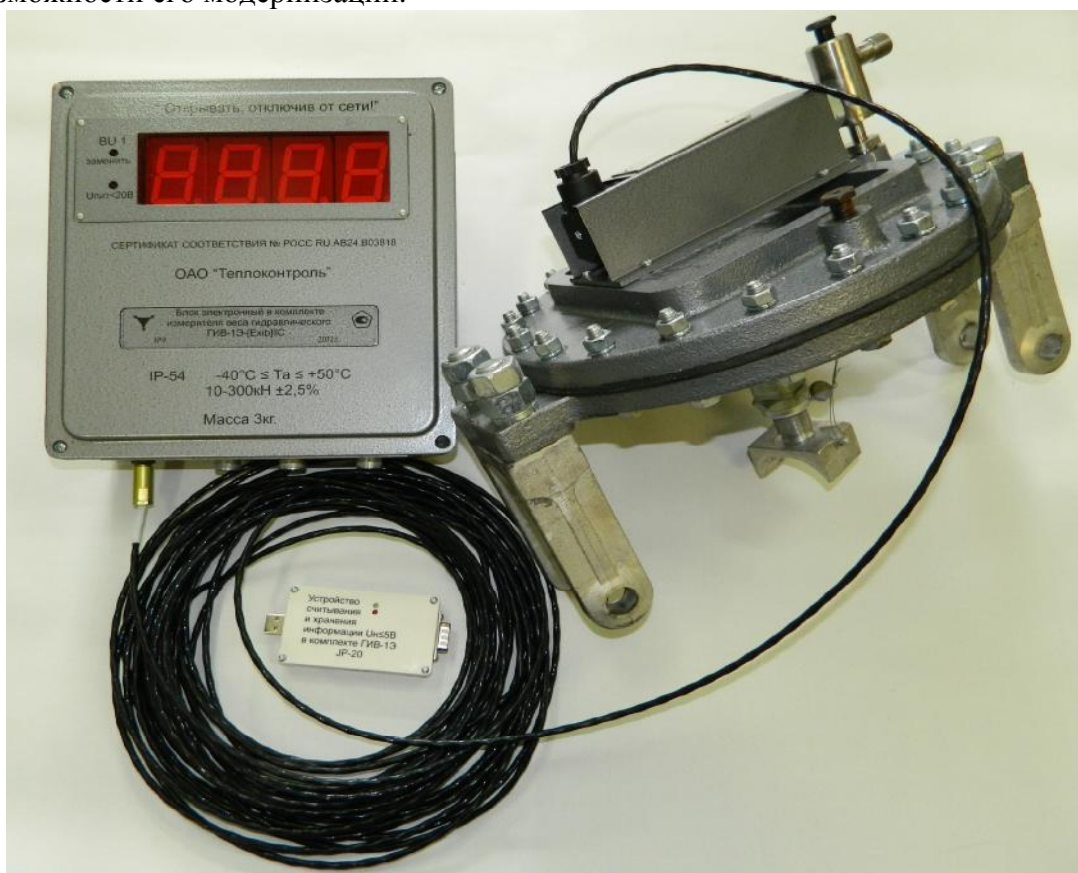
Общий вид измерителя веса гидравлического электронного ГИВ-1Э

Обработка метрологических данных происходит на основе жестко определенного алгоритма без возможности его модернизации.