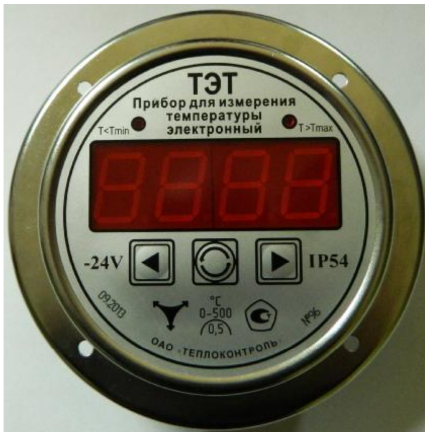
Рис.1 Общий вид прибора для измерения температуры ТЭТ

Приборы оснащены интерфейсом RS 232 для передачи значений температуры с фиксацией реального времени на персональный компьютер.