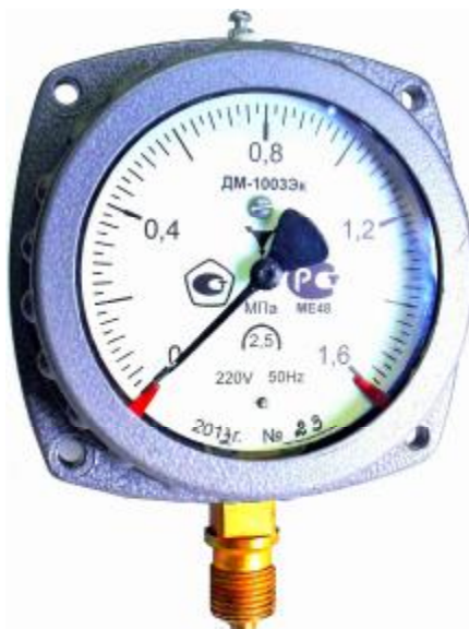
Общий вид манометра показывающего электроконтактного ДМ-1003 Эк

Сигнализирующее устройство манометров выполнено в виде двух электрических контактов, которые при эксплуатации можно установить на значение давления в пределах шкалы манометра, обеспечивая управление внешними электрическими цепями.